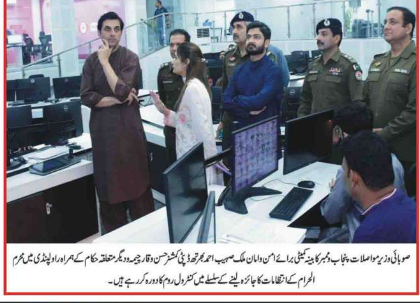
صوبائی وزیر مواصلات پنجاب ڈیپٹی کمشنر برائے امن و امان ملک صیب احمد بھٹو راولپنڈی میں محرم الحرام کے انتظامات کا جائزہ لینے کے سلسلے میں کنٹرول روم کا دورہ کر رہے ہیں۔

کیمروں کے ذریعے مسلسل مانیٹرنگ کی گئی۔ جبکہ یوم عاشور کے مرکزی جلوسوں اور عوامی جلوسوں کی صفائی ستھرائی اور عزاداروں کے لئے مٹھے پانی کی سہولیات کا اہتمام کیا گیا ہے۔ وزیر اعلیٰ پنجاب مریم نواز شریف نے محرم الحرام میں امن و امان کو قائم رکھنے کے لیے ضلعی انتظامیہ، قانون نافذ کرنے والے اداروں اور دیگر متعلقہ محکموں کے باہمی تعاون سے بہترین انتظامات کیے گئے۔ سیکورٹی کے ذریعے امن و امان کو برقرار رکھنے میں اپنا تھمیری کردار ادا کیا ہے۔ وزیر اعلیٰ پنجاب مریم نواز شریف کے ویشن کی ذمہ داری حکومت کے لیے ہے۔ وزیر اعلیٰ پنجاب مریم نواز شریف کی ہدایت پر راولپنڈی میں سیکورٹی اور عوامی جلوسوں کے انتظامات کے لیے تمام اقدامات مکمل اور تمام ادارے مکمل ہم آہنگی کے ساتھ فیلڈ میں موجود ہیں۔ حکومت پنجاب امن و امان کے قیام اور عزاداروں کو بہترین سہولیات کی فراہمی کے لیے تمام وسائل بروئے کار لا رہی ہے۔ سیف سٹی، سی سی ٹی وی کیمروں اور جدید مانیٹرنگ سسٹم کے