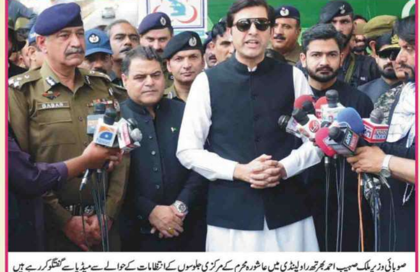
صوبائی وزیر ملک صیب احمد بھٹو راولپنڈی میں عوامی جلوسوں کے انتظامات کے حوالے سے میڈیا سے گفتگو کر رہے ہیں

مزید برآں وزیر لیک پولیس اہلکاروں نے فرائض سر کے جلوسوں کے روٹس کی نگرانی کے عمل کا جائزہ لیا۔ صوبائی وزیر نے انتظامیہ کے ہمراہ مدرسہ تعلیم القرآن کے منتظمین سے ملاقات کی اور امن و امان قائم رکھنے کے لیے ان کے کردار کو سراہا۔ صوبائی وزیر کا کہنا تھا کہ یوم عاشور کے پر امن انعقاد کے لیے تمام انتظامات مکمل اور تمام ادارے مکمل ہم آہنگی کے ساتھ فیلڈ میں موجود ہیں۔ حکومت پنجاب امن و امان کے قیام اور عزاداروں کو بہترین سہولیات کی فراہمی کے لیے تمام وسائل بروئے کار لا رہی ہے۔ سیف سٹی، سی سی ٹی وی کیمروں اور جدید مانیٹرنگ سسٹم کے