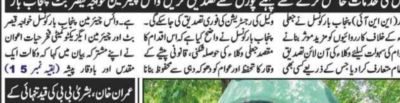
لاہور (ای این آئی) پنجاب بار کونسل نے جعلی وکلاء کی رجسٹریشن کی فوری تصدیق کی جا سکتی ہے۔