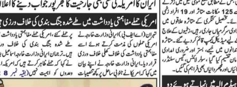
لاہور (ای این آئی) موٹروے ایم 2 پر حادثہ میں ایک شخص جاں بحق ہوئے اور تین افراد زخمی ہوئے۔

موٹروے پولیس نے فوری امدادی کارروائیاں کرتے ہوئے زخمیوں کو اسپتال منتقل کر دیا۔