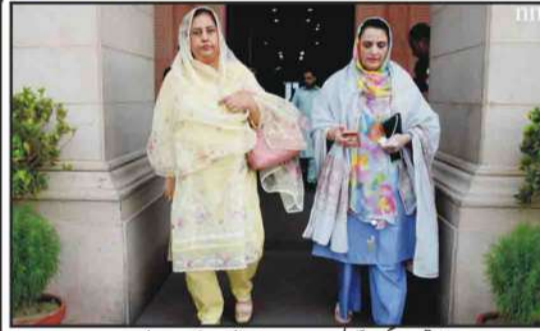
لاہور: خواتین اور ایٹمی بجٹ اجلاس میں شرکت کے بعد واپس جا رہی ہیں

سپیکر قومی اسمبلی سردار ایاز صادق کی ریجنر زہا کاروں پر دستگیر عملہ انتہائی افسوسناک اور قابل مذمت قرار دیا ہے۔