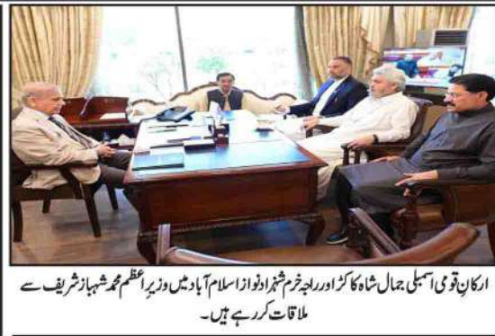
ارکان قومی اسمبلی جمال شاہ کا رکن اور وزیر اعلیٰ پنجاب شہباز شریف سے ملاقات کر رہے ہیں۔

گرو ارجن دیو جی کے شہیدی دن کی تقریبات میں شرکت کیلئے آئے۔ (بقیہ نمبر 4 1)