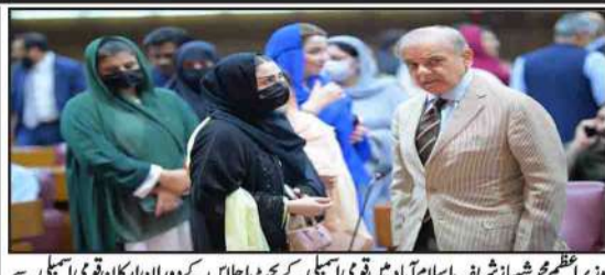
وزیر اعظم محمد شہباز شریف اسلام آباد میں قومی اسمبلی کے بجٹ اجلاس کے دوران ارکان قومی اسمبلی سے ملاقات کر رہے ہیں۔

غیر ملکی فرمائش، برائڈ، رائلٹی اور دیگر خدمات حاصل کرنے والی کمپنیوں کو ٹیکس ایڈجسٹمنٹ کی سہولت فراہم کرنے کی تجویز شامل موجودہ قوانین میں بعض تضادات کے باعث متعدد ملٹی نیشنل کمپنیاں پنجاب میں ٹیکس ادائیگی سے گریز کر رہی تھیں، حکام کا دعویٰ ہے۔ لاہور (این ای این) پنجاب حکومت نے سب سے پہلے قوانین میں اہم ترین تبدیلی کی منظوری دے دی ہے، جن کے تحت غیر ملکی فرمائش، برائڈ، رائلٹی اور دیگر خدمات حاصل کرنے والی کمپنیوں کو ٹیکس ایڈجسٹمنٹ کی سہولت فراہم کرنے کی تجویز شامل ہے۔ حکام کے مطابق موجودہ قوانین میں بعض تضادات کے باعث متعدد ملٹی نیشنل کمپنیاں پنجاب میں ٹیکس ادائیگی سے گریز کر رہی تھیں جبکہ کئی کمپنیوں نے قوانین (بقیہ نمبر 1)