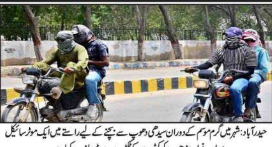
حیدرآباد شہر میں گرم موسم کے دوران سڑکیں چھوٹے گاڑیوں سے بھری ہوئی ہیں۔

پولٹری انڈسٹری کی بنیادی اکائی چوزے کی قلت کی وجہ سے بحران کی صورتحال پیدا ہوئی۔ (بقیہ نمبر 5 4)