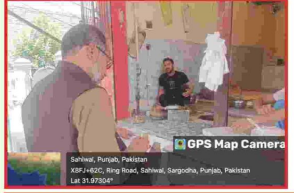
GPS Map Camera Sohawal, Punjab, Pakistan K8F+R5D9C, Ring Road, Sohawal, Sangarhota, Punjab, Pakistan Lat: 31.973244°

عوام کو دو نہیں تین وقت کی سستی روٹی کی فراہمی کا مشن