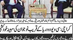
ایسٹیمو اور ایف آئی کے درمیان معاملات طے پا گئے۔ اسلام آباد (این آئی این) وفاقی وزیر منصوبہ بندی، سرمایہ کاری اور معاشی امور، حسن اقبال نے کہا ہے کہ پاکستان میں 7 فیصد معاشی گروتھ سے 2047 تک پاکستان کو 2 ہزار ارب ڈالر کی معیشت بن سکے گی۔ سرمایہ کاری کے فروغ کیلئے ای ٹی ایف ای کی کردار قابل توجہ ہے، وفاقی وزیر منصوبہ بندی کا خطاب۔