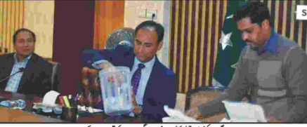
مرگوبہ ڈویژن کے 300 ممبروں کو بائیسویں بلانے کے لیے فراہم کیے جائیں گے۔

74 فیصد مفت بائیسویں بلانے کیلئے قرضہ لانداری مرگوبہ 43، خوشاب 14، اوائل 12 اور دیگر 05 صوبائی حکومت بائیسویں بلانے کے لیے جاری کیے گئے ہیں۔ مرگوبہ ڈویژن کے 300 ممبروں کو بائیسویں بلانے کے لیے فراہم کیے جائیں گے۔ مرگوبہ ڈویژن کے 300 ممبروں کو بائیسویں بلانے کے لیے فراہم کیے جائیں گے۔ مرگوبہ ڈویژن کے 300 ممبروں کو بائیسویں بلانے کے لیے فراہم کیے جائیں گے۔