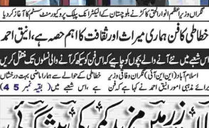
آئی جی نے کئی سٹیشنوں پر پولیس کی نفری بڑھانے کی ہدایت کی