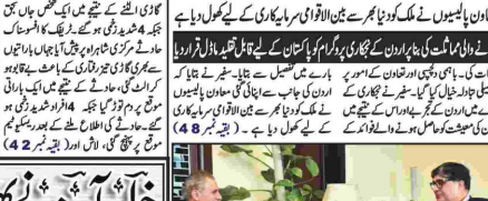
وزیر خارجہ کا ریفیوئل فنانسنگ کے لیے سفیر کی ملاقات