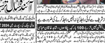
اسٹیشنل سٹریٹس میں مزید سیکیورٹی کی پیشین گوئی