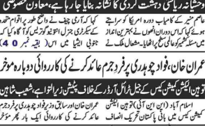
ایکشن کوئی صورت پرستی اتنے نہیں دینگے سپریم کورٹ