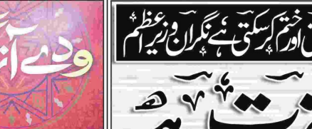
عمان وزیر اعظم اور ان کی بیوی نے پاکستان پر سفر کرنے کے لیے پاکستانی وفد سے خطاب کر رہے ہیں