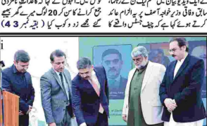
خواجه آصف نے پھر میز پر چڑھ کر کہا والدہ عثمان ڈار