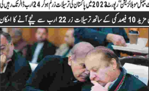
اسٹیشنل سٹریٹس میں مزید سیکیورٹی کی پیشین گوئی