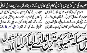
پنجاب میں زلزلے سے جانی و مالی نقصان پر دکھ اور سوس کا اظہار