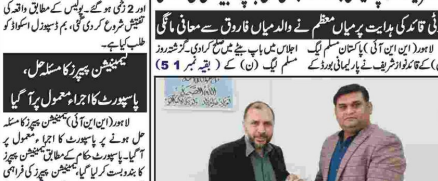
آئی جی نے کئی سٹیشنوں پر پولیس کی نفری بڑھانے کی ہدایت کی