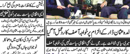
خواجه آصف نے پھر میز پر چڑھ کر کہا والدہ عثمان ڈار