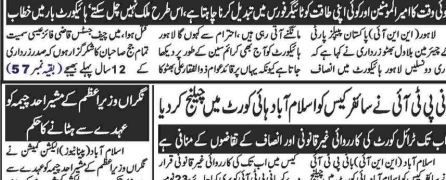
اسٹیشنل سٹریٹس میں مزید سیکیورٹی کی پیشین گوئی