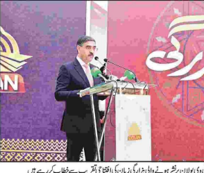
عمان وزیر اعظم اور ان کی بیوی نے پاکستان پر سفر کرنے کے لیے پاکستانی وفد سے خطاب کر رہے ہیں

عام انتخابات 2024ء کیلئے قائدات نامزدگی کا اجراء شروع کیا گیا ہے۔ ان کے مطابق قائدات نامزدگی سے ملک کی معیشت کو فائدہ ہوگا اور عورتوں کی حق شناسی ہوگی۔