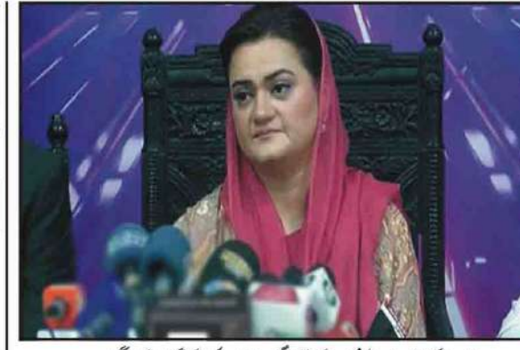
لاہور ملک میں پارسل فرٹ سے لے کر، ہر ادارے کو تیار کیا گیا ہے، اور گریپ

وزیراعظم کے معاون خصوصی نے کہا کہ شہدائے یادگاروں کی بے حرمتی کرنے والوں کے خلاف کیا فیصلہ ہوا ہے؟ پاکستان کی فوج اور قوم کے درمیان تقسیم کی سازشیں ہورہی ہیں، سازشوں کیلئے 70 فیصد بھارت سے مہم چلائی جاتی ہے، طاہر محمودی شرنی لاہور) نامہ نگار ڈیز ایٹر اعظم کے معاون حافظ جاہر شرنی نے کہا ہے کہ 9 مئی کو ریاست پر حملہ ہوا، واقعات میں موٹ لوگوں کے قتل ہوئے، لاکھ لاکھ لوگوں کی جانیں بے گناہ ہوئیں، آج دنیا بھر میں بے گناہ لوگوں کی موت ہو رہی ہے۔ وزیراعظم کے معاون خصوصی نے کہا کہ شہدائے یادگاروں کی بے حرمتی کرنے والوں کے خلاف کیا فیصلہ ہوا ہے؟