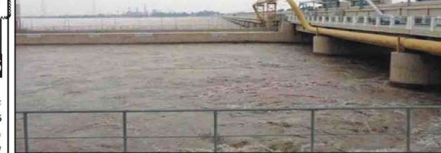
لاہور: بھارت نے دریائے راوی میں پانی چھوڑ دیا، بھارتی کھلیاں