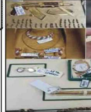
اسلام آباد: توشہ خانہ فوجداری کارروائی میں اسلام آباد ہائی کورٹ کل فیصلہ سنانے کی

پشاور (جزل رپورٹر) پنی آئی قیادت نے سابق وفاقی وزیر پرویز خٹک کی بنیادی رکنیت ختم کرنے اور پارٹی سے نکالنے کا فیصلہ کر لیا اور ایس این کو تحریک انصاف چھوڑنے کیلئے اسے اور شوکارا نوٹس کا جواب دینے پر پرویز خٹک کو پارٹی سے نکالنے کا فیصلہ کیا گیا۔