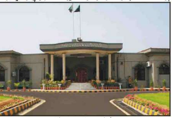
اسلام آباد: ججز میں نی آئی کا چیف جسٹس اسلام آباد ہائی کورٹ پر عدم اعتماد اظہار