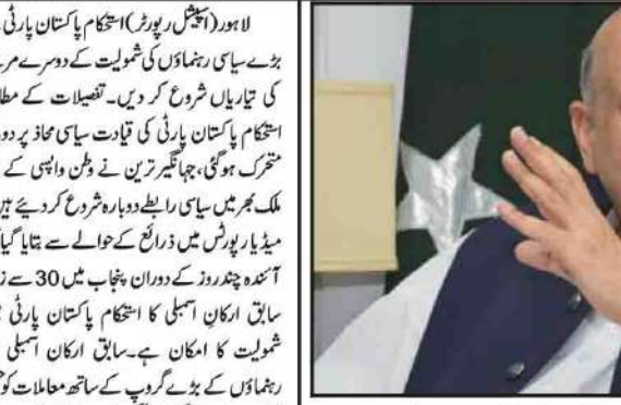
لاہور: ججز میں نی آئی کا چیف جسٹس اسلام آباد ہائی کورٹ پر عدم اعتماد اظہار

سیاحتی اداروں کو عید الاضحیٰ کی کارکردگی رپورٹ جاری کی گئی۔