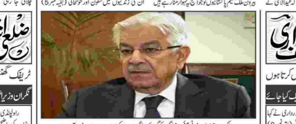
ایف ایف سی کے چیف ایگزیکٹو آفیسر ایف ایف سی کے چیف ایگزیکٹو آفیسر

عید الاضحیٰ کی مبارکباد اور عید قربان پر جھوٹ، منافقت اور بغیضت کو ہمیشہ کیلئے قربان کرنے کا عہد کرنا جو گا