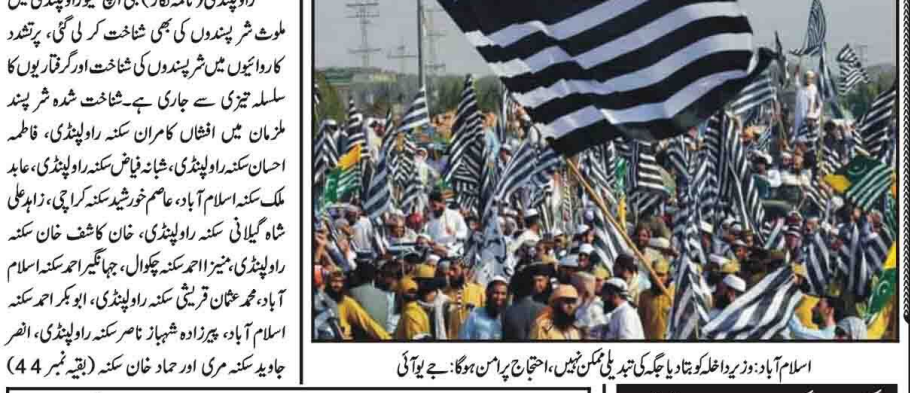
اسلام آباد: وزیر داخلہ کو نظر بند کرنا یا جیل میں قتل خاندان خورشید