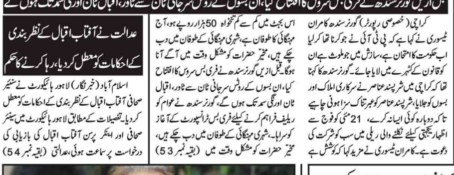
اسلام آباد: وزیر داخلہ کو نظر بند کرنا یا جیل میں قتل خاندان خورشید