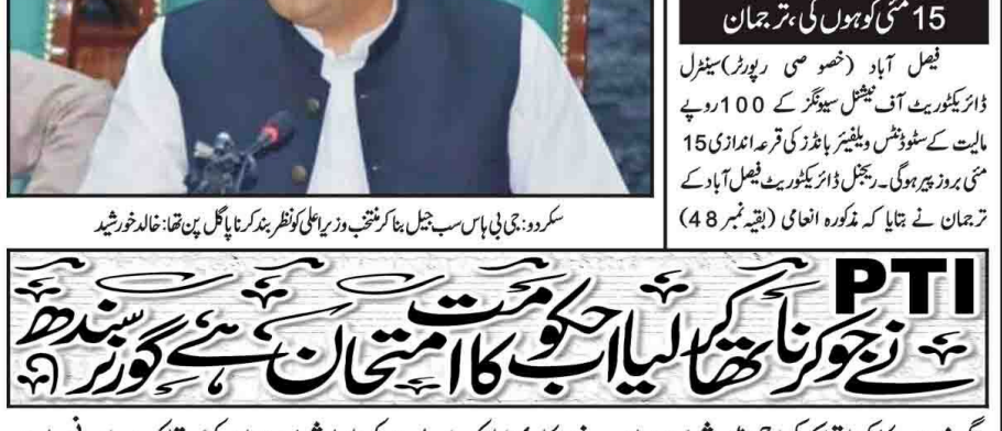
اسلام آباد: وزیر داخلہ کو نظر بند کرنا یا جیل میں قتل خاندان خورشید