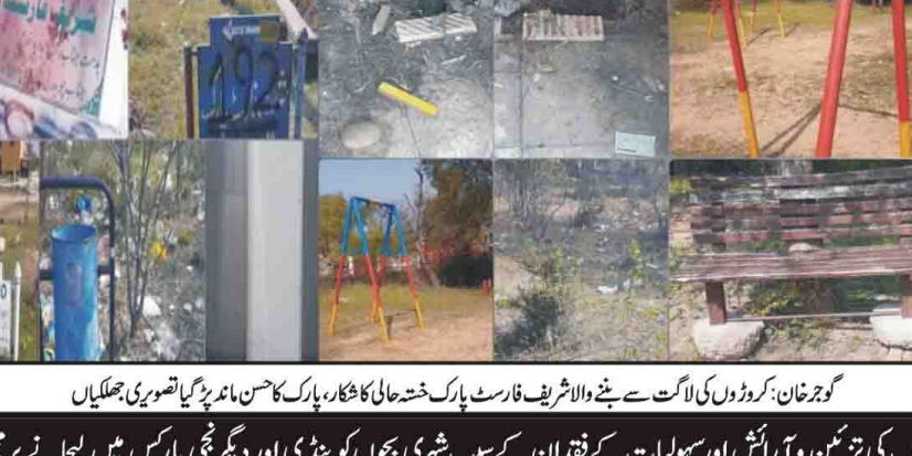
گوجرخان: کرڈوں کی لاکٹ سے بننے والا شریف فارمسٹ پارک خشتی کار کھار، پارک کاسن نامہ پڑائی تصویریں جھلمکیاں

اسلام آباد (جنگ جہاد) وفاقی وزیر منصوبہ بندی اسحاق ڈار کا کہنا ہے کہ عمران یاسیٰ نے عدلیہ کو بھی بے رحمی سے نشانہ بنایا ہے۔ ان کے درجنوں اکاؤنٹ بکلسے جا پھینچے ہیں۔ اسٹیشن اقبال نے کہا کہ عمران خان بیرون ممالک سے چندہ اٹھا کر کے سیاست چلائے تھے، بیرون ممالک تقیم پاکستانیوں کو بڑے زخموں سے بچانے کے لیے یہی سب سے بہتر راستہ تھا۔