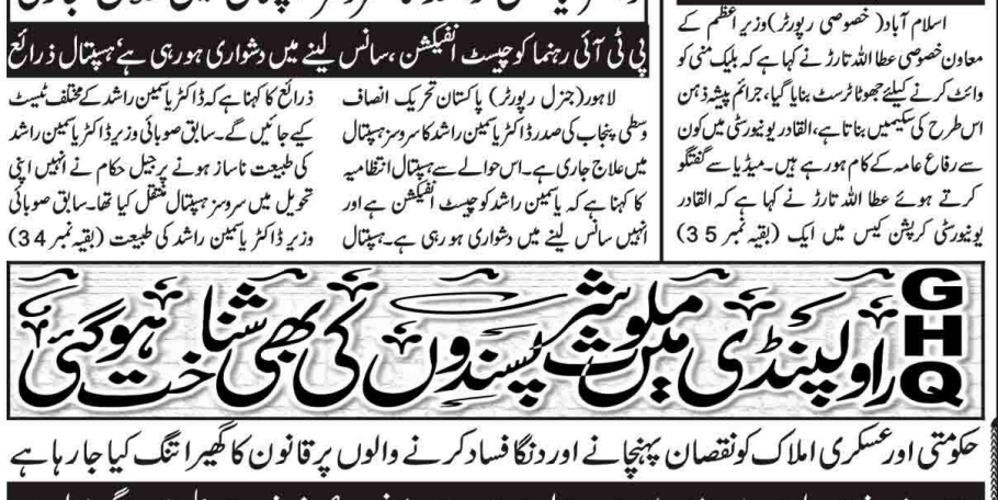
اسلام آباد: 190 ملین پاٹوقوم کا پیسہ تقسیم عمران خان کو جواب دینا ہوگا؛ عطا اللہ تارڑ