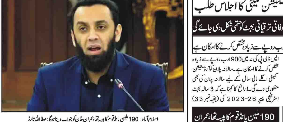
اسلام آباد: 190 ملین پاٹوقوم کا پیسہ تقسیم عمران خان کو جواب دینا ہوگا؛ عطا اللہ تارڑ

ہنگاموں اور پرتشدد مظاہروں کے بعد لاہور کا چڑیا گھر کھول دیا گیا ہے۔ حکومت نے اس بارے میں فیصلہ کیا ہے۔