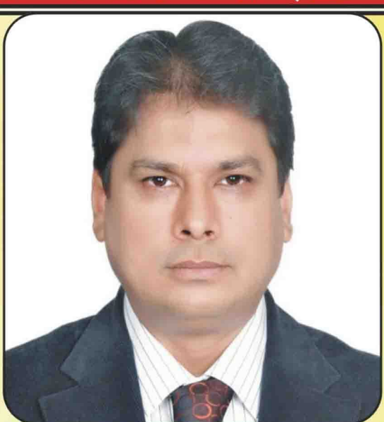
وزیر اطلاعات پنجاب: عامر میر

ہونے والے کس کے بعد سے جنگی پولیو وائرس کا آغاز ہو گیا ہے۔ ہم کے دوران پانچ سال تک کی عمر کے بچوں کو ویکسین کے قطرے پلانے کا ہدف ہے۔ 2020 تک، جنگی پولیو وائرس صرف دو ممالک میں گردش کرتا رہا ہے (پاکستان اور افغانستان) اور پولیو کے عالمی واقعات میں 99 فیصد کی کمی آئی ہے۔