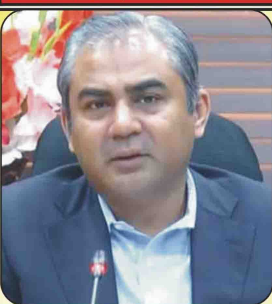
نگران وزیر اعلیٰ پنجاب: سید حسن رضا نقوی