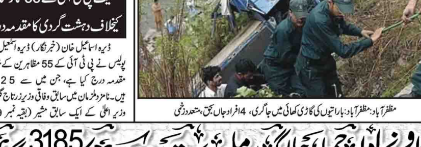
ظہیر آباد: مظفر آباد، رانیٹوں کی گاڑی میں حادثہ، جاگری، 14 افراد جاں بحق، حادثہ

پارکس کی تزئین و آرائش اور سہولیات کے فقدان کے سبب شہری بچوں کو پھنڈی اور دیگر نجی پارکس میں لیجانے پر مجبور ہو رہے ہیں۔ شہریوں کی جانب سے پارکس کی حالتوں کی شکایتیں بڑھتی جا رہی ہیں۔