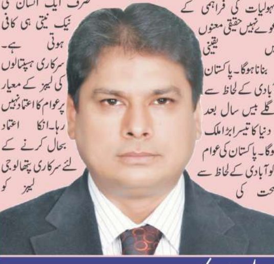
عامر میر / نگران وزیر اطلاعات و نشریات پنجاب

صحت اللہ پاک کی ایک انمول نعمت ہے۔ صحت کی سہولیات کی فراہمی پر انسان کا بنیادی حق ہے۔ ایک صحت مند انسان ہی صحت مند زندگی گزار سکتا ہے۔ عوام کو صحت کی بنیادی سہولیات کی فراہمی کے دعوے نہیں حقیقی معنوں میں یقینی بنانا ہوگا۔ پاکستان آبادی کے لحاظ سے اگلے بیس سال بعد دنیا کا تیسرا بڑا ملک ہوگا۔ پاکستان کی عوام کو آبادی کے لحاظ سے صحت کی