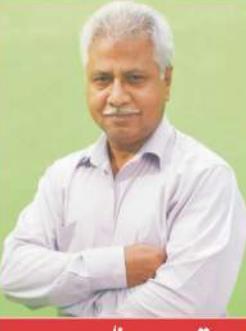
تحریر۔ ناظم الدین ڈائریکٹر تعلقات عامہ پنجاب

جنوبی پنجاب کے تمام ہسپتالوں میں ڈاکٹروں کی کمی کو ترجیح بنیادوں پر پورا کیا جا رہا ہے