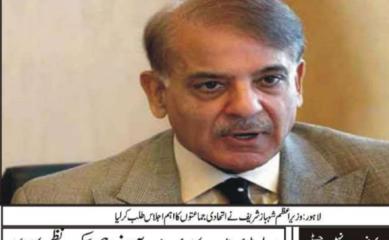
لاہور وزیراعظم شہباز شریف نے اجلاس میں اجلاس طلب کر لیا

جسٹس فیصل کے فیصلے کی کوئی حیثیت نہیں ہوگا دن میں جو توجہ کا باعث بنے گا۔ عوامی راز میں نواز نے اسن اقبال کے ٹویٹ پر چبھتا ہوا تبصرہ بھی کیا