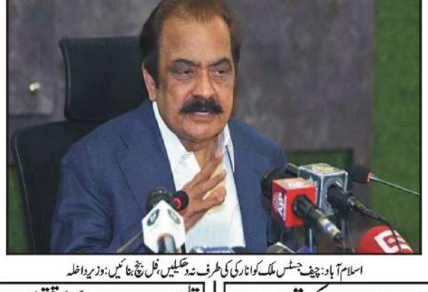
اسلام آباد: چیف جسٹس ملک کوٹوالہ کی طرف سے جج جی ایچ ایم ڈی ریڈارڈ