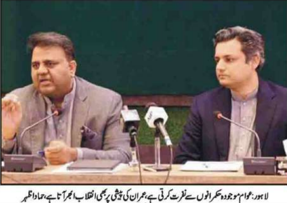
لاہور: عوام موجودہ محرموں سے نفرت کرتے ہیں۔ عمران کی قومی پارٹی کا انتخاب ہجرت ہے۔

پٹوریا (خبرنگار) پاکستان اور افغانستان کو ملانے والی طوفان سرحد پر دونوں ملکوں کی فوجوں کے درمیان شدت سے فائرنگ کا تبادلہ ہوا ہے جس کے بعد پاکستان کی فوجیں افغانستان کے لیے بند کر دی گئیں۔ افغانستان کی فوجوں نے پاکستان کی فوجوں کے خلاف فائرنگ کا تبادلہ جاری رکھا ہے۔