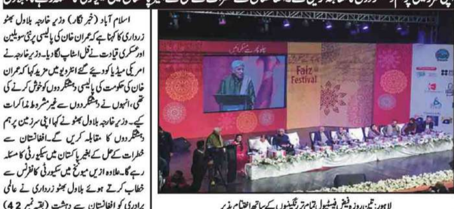
لاہور: تین روزہ پیش قدمیوں کے ساتھ اختتام پانچ

عمران خان کی حکومت کی پالیسی دیکھ کر وہیں کو خوش کرنے کی تھی، انہوں نے دیکھ کر وہیں کو خوش کرنے کی تھی، انہوں نے دیکھ کر وہیں کو خوش کرنے کی تھی۔