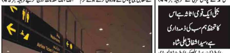
اسلام آباد: وفاقی حکومت نے اسلام آباد پانچ پینگ بازون اور پینگ فروٹوں کے خلاف کارروائی کی۔

پنی پولیس نے کارروائی کرتے ہوئے طوم خاور 55 پینگ بازون اور پینگ فروٹوں کے خلاف کارروائی کی۔