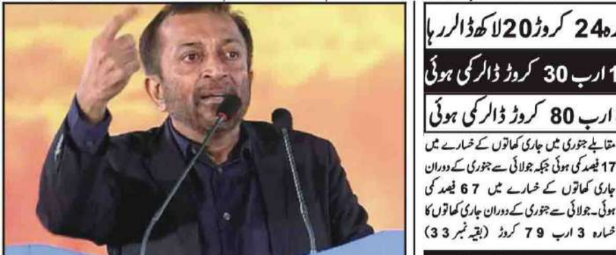
کراچی: پیپلز پارٹی کے رہنما، مقتدر اداروں کی طرف دیکھ رہے ہیں، قادیان سٹار

سندھ میں انجمنیہ کے واقعات میں بہت اضافہ ہوا ہے اس سے زیادہ خورخیزہ کرنے والا جرم کوئی نہیں، رہنما تحریک انصاف تاراوان کے واقعات میں بہت اضافہ ہوا ہے اس سے زیادہ خورخیزہ کرنے والا جرم کوئی نہیں جکڑے گا۔