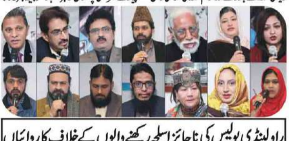
گورنمنٹ دھمیل فورم کی مرکزی کونسل کا اہم اجلاس کے بعد گورنر ڈپٹی

اپنے اختلافات بھلا کر پاکستان کو ہر سطح پر مضبوط کرنا ہم سب پر فرض ہے: مقررین۔