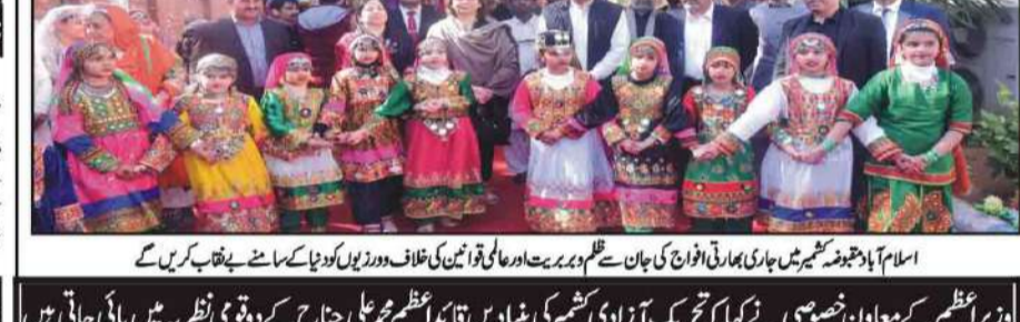
اسلام آباد: پنجاب میں جاری امدادی افواج کی جان سے غم و برص اور عالمی قدرتی ترقی کے خلاف دورز میں کولونیا کے سامنے بے نقاب کریں گے

گیس سہڈی میں کسی بھی کونٹی سے پہلے جامع اصلاحی منصوبہ ہونا چاہیے۔