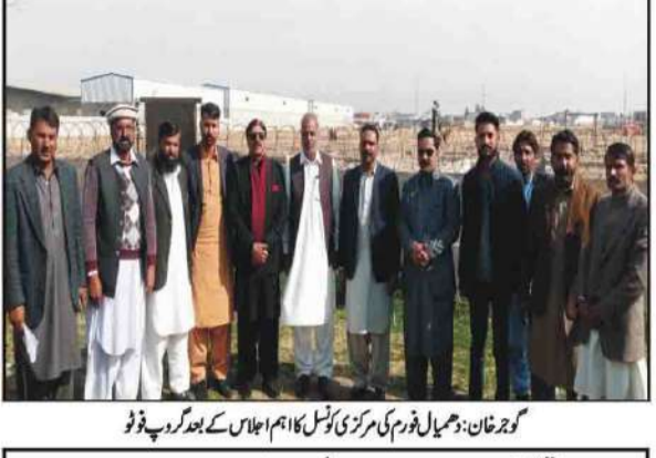
گورنمنٹ دھمیل فورم کی مرکزی کونسل کا اہم اجلاس کے بعد گورنر ڈپٹی

گورنمنٹ (قرمز) فیصلہات کے مطابق کراچی (سی ایم ڈی) کی قیادت میں دھمیل فورم کی مرکزی کونسل کا اہم اجلاس مندرجہ نکلے ہاؤس میں منعقد ہوا۔ اجلاس میں صحت اور وزارت صحت کے کام کی بحال کو 4 بجے کراچی میں اہم اجلاس ہوگا جس کا