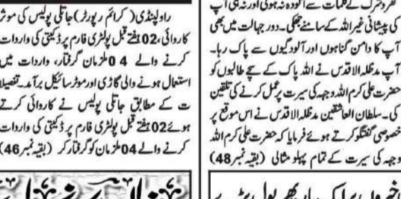
قادیانہ پولیس کی ناجائز اسلحہ رکھنے والوں کے خلاف کارروائیاں

10 ملزمان گرفتار، اسلحہ 10 ہتھیاروں کے ساتھ، مقدمہ درج، قادیانہ پولیس۔