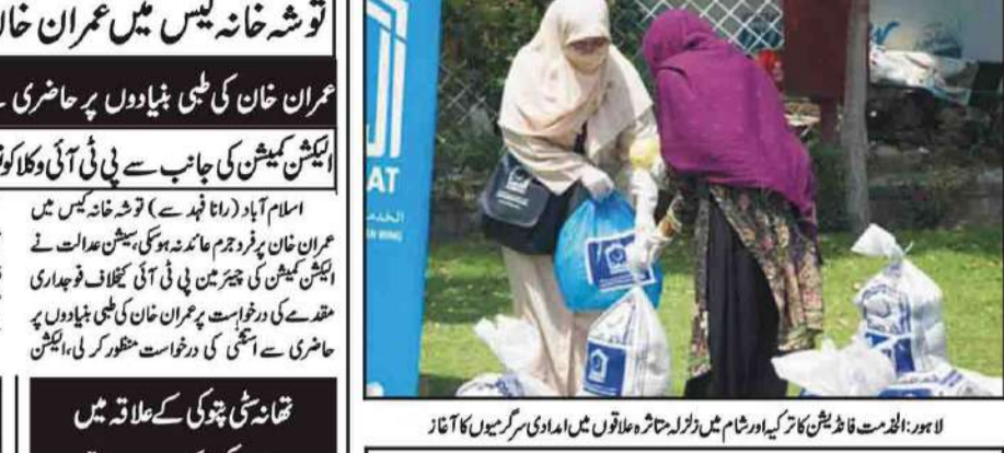
لاہور: حکومت فاؤنڈیشن کا تزکیہ اور کام میں مڈم ڈسٹرکٹ قاضیوں کی امداد کی سرگرمیوں کا آغاز

امین آباد (جنرل رپورٹ) قافہ منڈی صدر مرکزی کونسل میں کھانہ پھیلانے کے لیے ہرگز نہ ہونے دیا جائے۔