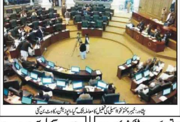
پشاور: چیئرپرسن جتوئی اسمبلی کی تحلیل کا معاملہ لٹک گیا، اپوزیشن نے کاؤٹ بن گیا

اسلام آباد ہائی کورٹ کے جسٹس محسن اختر کیانی نے ہائی ایف ایم کیو ایم کے ذمہ داروں نے کون سی قرارداد منظور کی؟ کیسٹریٹ کے ذمہ داروں نے کون سی قرارداد منظور کی؟ کیسٹریٹ کے ذمہ داروں نے کون سی قرارداد منظور کی؟ کیسٹریٹ کے ذمہ داروں نے کون سی قرارداد منظور کی؟