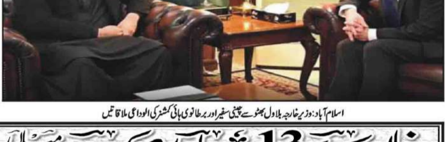
اسلام آباد: وزیر خارجہ بلاول بھٹو سے جی سی سی اور برطانوی ہائی کمیشن کی افواجی ملاقات