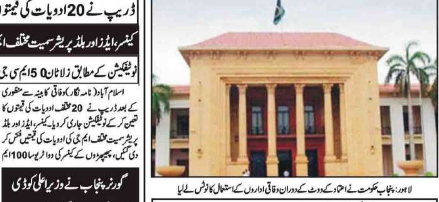
لاہور: پنجاب حکومت نے احمدیہ کے دوران وفاقی اداروں کے استعمال کا نوٹس لے لیا

جاری کردہ اعداد و شمار کے مطابق گزشتہ 24 گھنٹوں کے دوران 4 ہزار 050 کورونا ٹیسٹ کئے گئے، این آئی اے کے مطابق اس دوران کورونا وائرس سے کوئی بھی مریض جاں بحق نہیں ہوا جبکہ 16 مریضوں کی حالت تشویش کا ہے