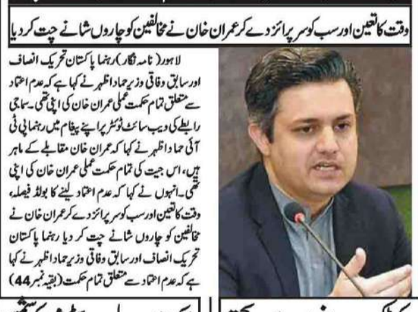
عمران خان: تمام حکمت عملی عمران خان کی اپنی تھی: حماد اظہر