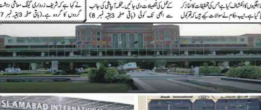
اسلام آباد: حکومت نے ملک کے تین بڑے ہوائی اڈوں کو آٹ سوئس کرنے کی منصوبہ بندی کر لی۔

عمران خان کے دور میں پاکستان تھا اور آج ہم آنکھوں میں آنکھیں ڈال کر ترحیمانی کرتے ہیں، آپ کے دور میں جب بھارت حملہ کرتا تھا آہیں، ہم نہیں کرتے تھے