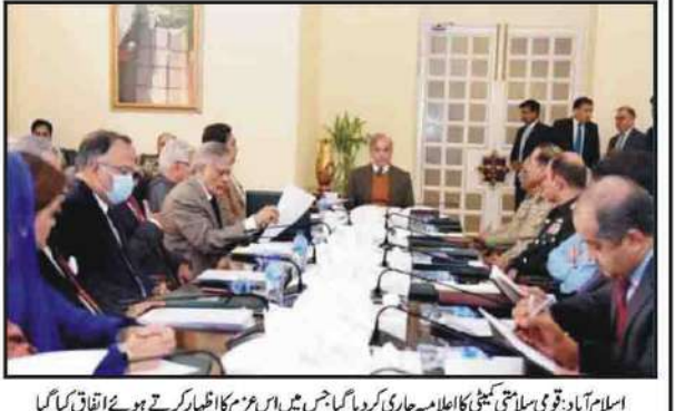
اسلام آباد قومی سلامتی کمیٹی کا اجلاس جاری کر دیا گیا جس میں اس مہم کا اظہار کرتے ہوئے اتفاق کیا گیا

بلدیاتی انتخابات کا اعلان کرانے کیلئے قانون سازی کی جائے: ایکشن کمیٹی کا اتفاق کو خوط اسلام آباد (پبلک ریلوے) ایکشن کمیٹی نے وفاقی حکومت کو بلدیاتی انتخابات کا اعلان کرانے کیلئے قانون سازی کرنے پر خط لکھ کر وزیر اعلیٰ کے مطابق ایکشن کمیٹی کی جانب سے وفاقی حکومت کو لکھے گئے خط میں کہا گیا ہے کہ قانون بنایا جائے گا تو اس کی تکمیل سے قبل 31 دسمبر (31 دسمبر) تک