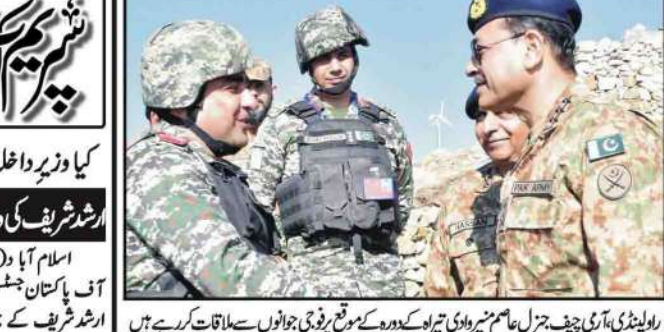
راولپنڈی آرمی چیف جنرل عامر پرویز کی سربراہی میں ایک دستہ کے اہلکاروں کے ساتھ ملاقات کر رہے ہیں

پاکستان ورکرز فیڈریشن کے عہدیداران کا قاضی نعیم ایڈووکیٹ کی وفات پر اظہار تعزیت مرحوم کی مزدوروں کے لیے خدمات قابل ستائش ہیں اسلام آباد (نامہ نگار) معروف قانون دان قاضی نعیم ایڈووکیٹ کی وفات پر پاکستان ورکرز فیڈریشن کے کئی عہدیداران نے تعزیتیں پیش کی ہیں۔ انہوں نے کہا کہ قاضی صاحب کی وفات ایک بڑے ہونہار شخص کی موت ہے اور ان کی خدمات قابل ستائش ہیں۔