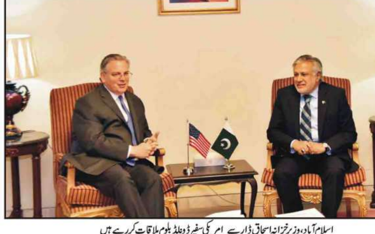
اسلام آباد، وزیر خزانہ اسحاق ڈار سے امریکی شہر ڈیٹا ویلڈ مل ملاقات کر رہے ہیں

2018 کے انتخابی بائبل سے سرسبز نئی نئی حکومت کی کوئی یاد دہانی نہیں جنرل (ر) قمر جاوید باجوہ کے ساتھ اعلیٰ تعلقات بھی رہے اور خراب بھی رہے، سابق وزیر اسلام آباد (این این آئی) پاکستان تحریک انصاف کے رہنما سید حفیظ نے کہا کہ 2018 کے عام انتخابات میں وفاقی وزیر اطلاعات فواد چودھری (بقیہ نمبر 3)