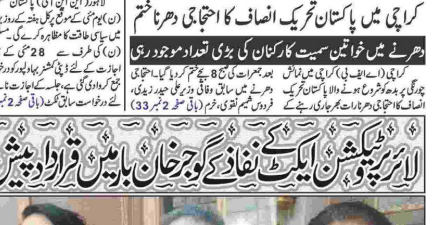
عزت عظیمی نے ایک نئی سیاسی پارٹی کی بنیاد رکھنے کے موقع پر خطاب کیا۔

عزت عظیمی نے ایک نئی سیاسی پارٹی کی بنیاد رکھی ہے۔ اس پارٹی کے بانیوں میں سابق وزیر اعلیٰ اور سابق وزیر داخلہ شامل ہیں۔