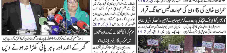
عمران نیازی کی انیما پائینسٹیٹ میں شہرہ شہباز

انتخابی فہرستوں پر 27 کروڑ 20 لاکھ روپے خرچ ہوں گے اسلام آباد (این آئی) سپریم کورٹ آف پاکستان نے عمران خان کے خلاف وفاقی حکومت کے چارج شیٹ میں شامل ایک دفعہ کے خلاف عدالت کے فیصلے کو مسترد کر دیا ہے۔ عدالت نے کہا کہ وفاقی حکومت نے عمران خان کے خلاف وفاقی عدالت کے فیصلے کو مسترد کر دیا ہے۔