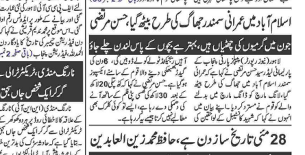
اسلام آباد کی ایک نئی جماعت کی بنیاد رکھنے کے موقع پر خطاب کیا۔

اسلام آباد کی ایک نئی جماعت کی بنیاد رکھی گئی ہے۔ اس جماعت کے بانیوں میں سابق وزیر اعلیٰ اور سابق وزیر داخلہ شامل ہیں۔