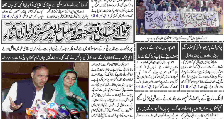
عمران نیازی کی انیما پائینسٹیٹ میں شہرہ شہباز

لوہان کی گرفتاری کے لیے 6 عیسائی تھیلوں میں مزید پابندی لگانے کی ضرورت ہے اسلام آباد (این آئی) سپریم کورٹ آف پاکستان نے عمران خان کے خلاف وفاقی حکومت کے چارج شیٹ میں شامل ایک دفعہ کے خلاف عدالت کے فیصلے کو مسترد کر دیا ہے۔ عدالت نے کہا کہ وفاقی حکومت نے عمران خان کے خلاف وفاقی عدالت کے فیصلے کو مسترد کر دیا ہے۔