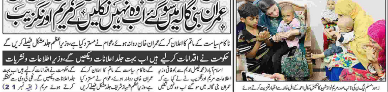
عمران نیازی کی انیما پائینسٹیٹ میں شہرہ شہباز

ایکٹ میں ترامیم کا بل پاس کر کے خشتا اختیارات کی بنیاد رکھ دی، کیا کسی جتنے یا جماعت کو ڈنڈے کے زور پر یہ حق دیا جا سکتا ہے کہ وہ آئین سے بنیاد کرے اسلام آباد (این آئی) سپریم کورٹ آف پاکستان نے عمران خان کے خلاف وفاقی حکومت کے چارج شیٹ میں شامل ایک دفعہ کے خلاف عدالت کے فیصلے کو مسترد کر دیا ہے۔ عدالت نے کہا کہ وفاقی حکومت نے عمران خان کے خلاف وفاقی عدالت کے فیصلے کو مسترد کر دیا ہے۔