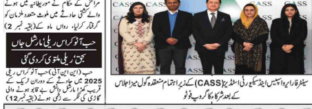
سیکرٹری عام اور دیگر افسران کی موجودگی میں ایف۔ سی۔ ایس۔ کے اہلکاروں کی طرف سے ایک تقریب منعقد کی گئی۔

مہنگے فواز کی شہریتوں کو جہانِ رمضان بھیج دینے کے لئے 15 فروری تک رجسٹریشن مکمل کرانے کی ہدایت عوام کو عزت و احترام کے ساتھ ان کا حق ملنا چاہیے۔ جہانِ رمضان بھیج دینے کے لئے عوام کا لاکھوں روپے کا نقصان ہو گیا ہے۔ عوام کی بے ساختہ لٹکار کے لئے 15 فروری تک رجسٹریشن مکمل کرانے کی ہدایت عوام کو عزت و احترام کے ساتھ ان کا حق ملنا چاہیے۔ جہانِ رمضان بھیج دینے کے لئے عوام کا لاکھوں روپے کا نقصان ہو گیا ہے۔ عوام کی بے ساختہ لٹکار کے لئے 15 فروری تک رجسٹریشن مکمل کرانے کی ہدایت عوام کو عزت و احترام کے ساتھ ان کا حق ملنا چاہیے۔ جہانِ رمضان بھیج دینے کے لئے عوام کا لاکھوں روپے کا نقصان ہو گیا ہے۔