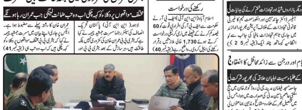
گورنر کی ذمہ داری لیں، گیس جنرل کی بجائے گورنر کی ذمہ داری لیں

گورنر کی ذمہ داری لیں، گیس جنرل کی بجائے گورنر کی ذمہ داری لیں۔ حکومت کے اراکین نے کہا کہ اگر حکومت گورنر کی ذمہ داری نہیں لیتی تو بلوچستان کی ترقی نہیں ہو سکتی۔