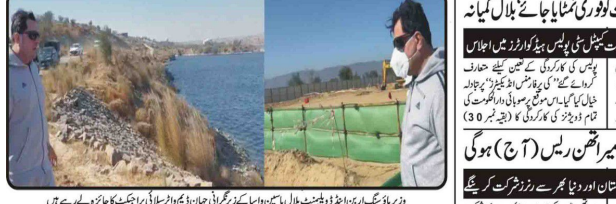
ڈیر بھنگ اور دھبہ ڈھبہ جیلوں میں ایس ڈی ایم کے مرنے والے نوجوان کی والدہ کا ایک جائزہ لے رہے ہیں