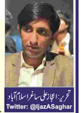
تحریر: ای جی اسحاق اسلام آباد Twitter: @JazASaghar

سید حسن نصر اللہ کی شہادت اور 57 اسلامی ممالک کی بحسی اسرائیل نے اسلامی ممالک کے اہم رہنماؤں کو نشانہ بن کر رکھ لیا۔ تین ماہ میں 14 اہم لیڈران شہید کر دیے اسرائیل کے دشمن نمبر 1 اور اسلامی دنیا کے سب سے بہادر لیڈر سید حسن نصر اللہ کو شہید کر دیا گیا ہے۔ یہ مسلمان دنیا کی بدقسمتی اور مغرب نواز ایرانی صدر مسعود پزھکیمان باغی ہو چکے ہیں انہوں نے سپریم لیڈر آیت اللہ خاٹمی کی حکم ماننا چھوڑ دیا ہے