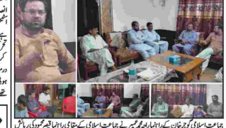
ڈسٹرکٹ انٹیکشن کمیشن میں ڈسٹرکٹ ڈیپارٹمنٹ کی کونسل کا اجلاس ہوا۔ ڈسٹرکٹ انٹیکشن کمیشن میں ڈسٹرکٹ ڈیپارٹمنٹ کی کونسل کا اجلاس ہوا۔ ڈسٹرکٹ انٹیکشن کمیشن میں ڈسٹرکٹ ڈیپارٹمنٹ کی کونسل کا اجلاس ہوا۔