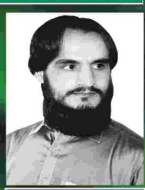
طالق خان ترین