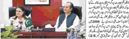
بینظیر انکم سپورڈ پروگرام کی غیر خیر خاتین کو شکر دینا