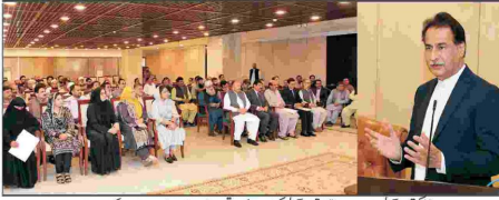
جنرل پرویز مشرف اور دیگر افسران کی میٹنگ کے دوران

ایف ڈی کے اسلام آباد ڈسٹرکٹ میں ڈیڑھ گھنٹے کا اجتماع