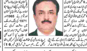
ایف ڈی کے اسلام آباد ڈسٹرکٹ میں ڈیڑھ گھنٹے کا اجتماع