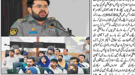
ایف ڈی کے اسلام آباد ڈسٹرکٹ میں ڈیڑھ گھنٹے کا اجتماع

شہریوں کو ڈی سی سی ایف کے ذریعہ ایف ڈی کے اسلام آباد ڈسٹرکٹ میں ڈیڑھ گھنٹے کا اجتماع