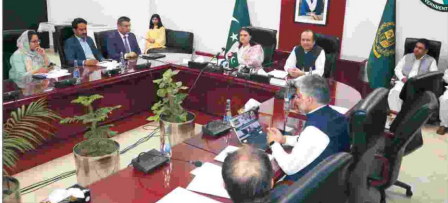
ایف ڈی کے اسلام آباد ڈسٹرکٹ میں ڈیڑھ گھنٹے کا اجتماع

شہریوں کو ڈی سی سی ایف کے ذریعہ ایف ڈی کے اسلام آباد ڈسٹرکٹ میں ڈیڑھ گھنٹے کا اجتماع