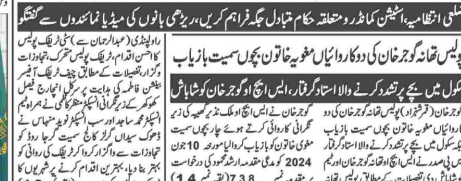
ایف ڈی کے اسلام آباد ڈسٹرکٹ میں ڈیڑھ گھنٹے کا اجتماع