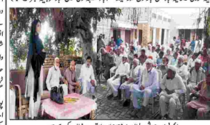
ایف ڈی کے اسلام آباد ڈسٹرکٹ میں ڈیڑھ گھنٹے کا اجتماع