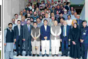
ایف ڈی کے اسلام آباد ڈسٹرکٹ میں ڈیڑھ گھنٹے کا اجتماع

اسٹیبلشمنٹ کے ترقی پانے والے ملازمین کو مبارکباد