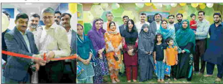
ایف ڈی کے اسلام آباد ڈسٹرکٹ میں ڈیڑھ گھنٹے کا اجتماع

بینظیر انکم سپورڈ پروگرام کی غیر خیر خاتین کو شکر دینا