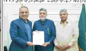
ایف ڈی کے اسلام آباد ڈسٹرکٹ میں ڈیڑھ گھنٹے کا اجتماع