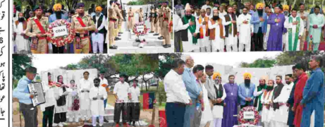
ایف ڈی کے اسلام آباد ڈسٹرکٹ میں ڈیڑھ گھنٹے کا اجتماع