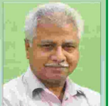
تحریر۔ ناظم الدین