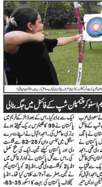
ایک شخص تیرپھول کھیل کر رہا ہے۔

پاکستان کے کھلاڑیوں نے ایشیا کی کھلاڑیوں کو شکست دی ہے۔ پاکستان کے کھلاڑیوں نے ایشیا کی کھلاڑیوں کو شکست دی ہے۔