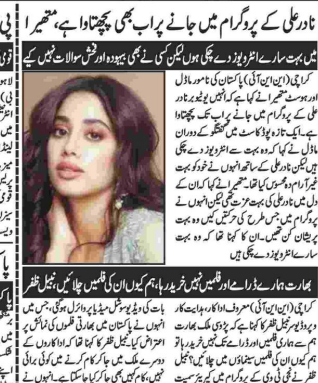
ایک مشہور فلم کی ہدایت کار ہیں۔