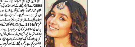
ایک مشہور فلم کی ہدایت کار ہیں۔