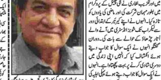
ایک مشہور فلم کی ہدایت کار ہیں۔