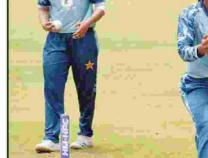
مبارک ٹی ٹی سی میچ میں کھیل رہے ہیں۔